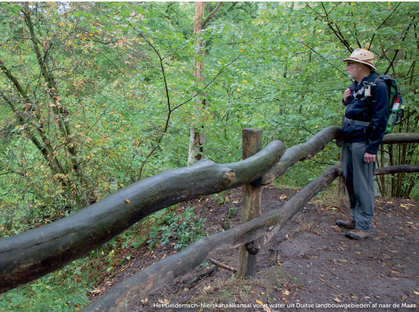
Het Geldernsch-Nierskanaalkanaal voert water uit Duitse landbouwgebieden af naar de Maas