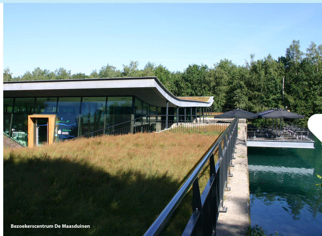
Bezoekerscentrum De Maasduinen