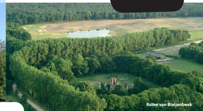
Ruïne van Bleijenbeek